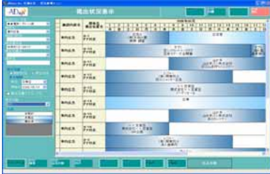
掲出スケジュール表示

申込業務や掲出業務など、業務毎に整理されたメニューを用意しております。また、広告の販売状況は、掲出スケジュール表示や掲出/空き状況一覧などの一目でわかりやすい画面で確認できるため、経験の少ない担当者でも正確かつ効率的に業務を行えます。