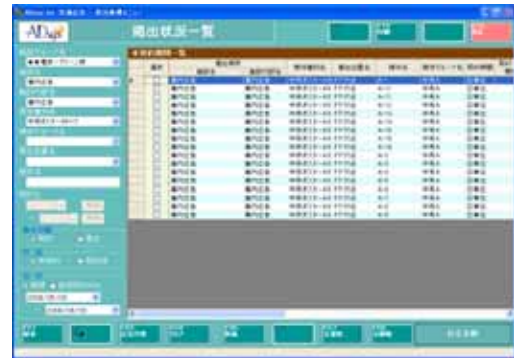
掲出/空き状況一覧